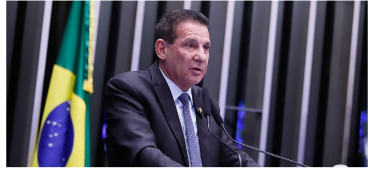
Vanderlan Cardoso aponta excessos do STF