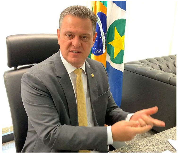
Plano Safra 2024/25 será lançado nesta quarta-feira, 26, em Brasília

A bancada do agronegócio na Câmara dos Deputados espera um montante de R$ 20 bilhões para a equalização de juros, além da destinação de R$ 2,5 bilhões para o Programa de Subvenção ao Prêmio do Seguro Rural (PSR).