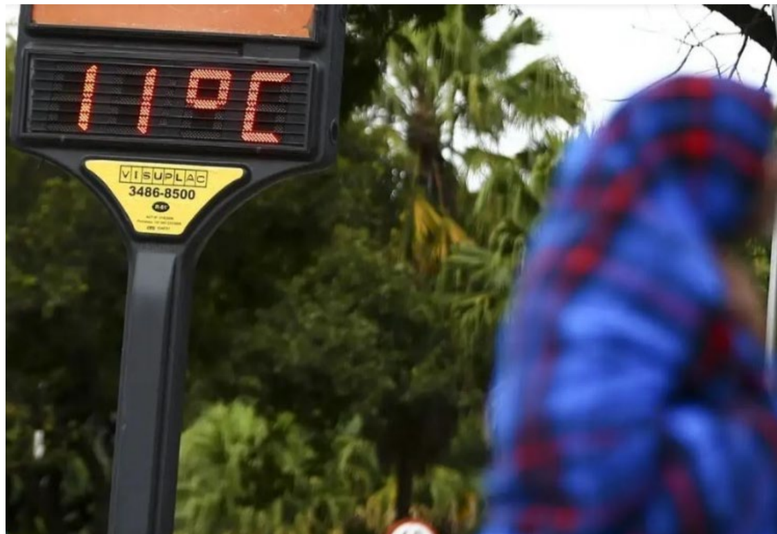
Instituto Nacional de Meteorologia (INMET) anunciou a chegada de uma onda de frio intenso no País

Pesquisa da Universidade de São Paulo (USP) analisou o impacto das ondas de frio e calor na mortalidade na população com 65 anos ou mais de idade