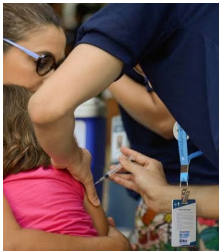
Ministério da Saúde emitiu nota que recomenda ações de vigilância da doença como a vacinação

Em maio deste ano, a União Europeia divulgou um Boletim Epidemiológico mostrando aumento da doença em pelo menos 17 países.