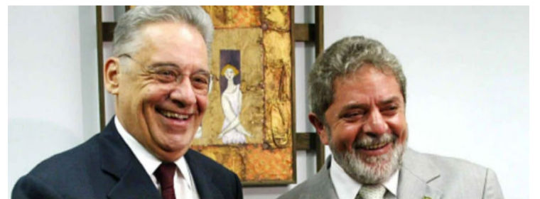
Fernando Henrique e Lula: aproximações e estremecimentos