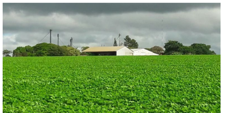
Seca no Centro-Sul não deixa produção 2024/25 de cana avançar

O diretor-presidente da Tereos no Brasil lembrou que o “mix” médio para açúcar do centro-sul, que foi de quase 49% no ano passado, poderia crescer para uma média de 51,6%, não fossem as condições