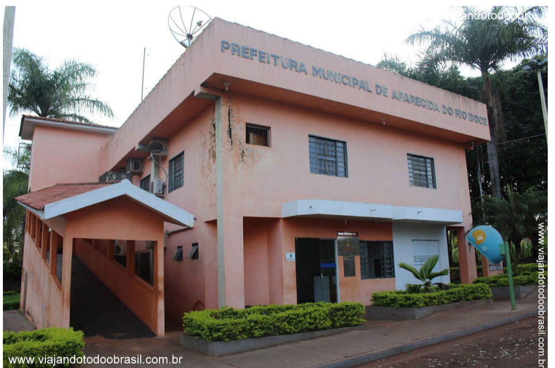
Concurso da prefeitura de Aparecida do Rio Doce terá validade de 2 anos e pode ser prorrogado por igual período.

As oportunidades são para os seguintes cargos: Agente Comunitário de Saúde; Eletricista; Gari; Guarda Noturno; Merendeira; Motorista; Auxiliar de Dentista; Fiscal Arrecadador; Auxiliar de Higiene e Alimentação; Agente de Contratação; Agente de Recursos Humanos; Monitor Escolar; Fonoaudiólogo; Odontólogo; Nutricionista; Fisioterapeuta; Professor de pedagogia, matemática, língua portuguesa, língua inglesa; Psicólogo; Secretária Escolar; Técnico de Enfermagem; Assistente Social e Farmacêutico.