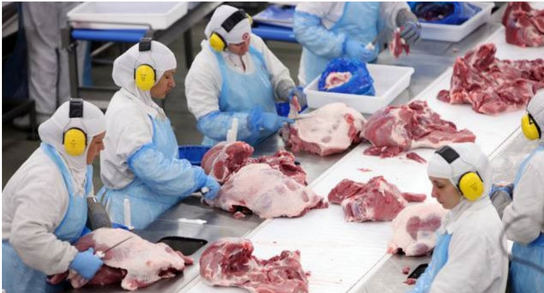
Estimativas apontam aumento na disponibilidade interna de carne bovina

Quanto ao consumo doméstico, acaba sendo medido pelas alterações dos preços da carne, que, por sua vez, recuam neste ano, mas menos que os valores do boi.