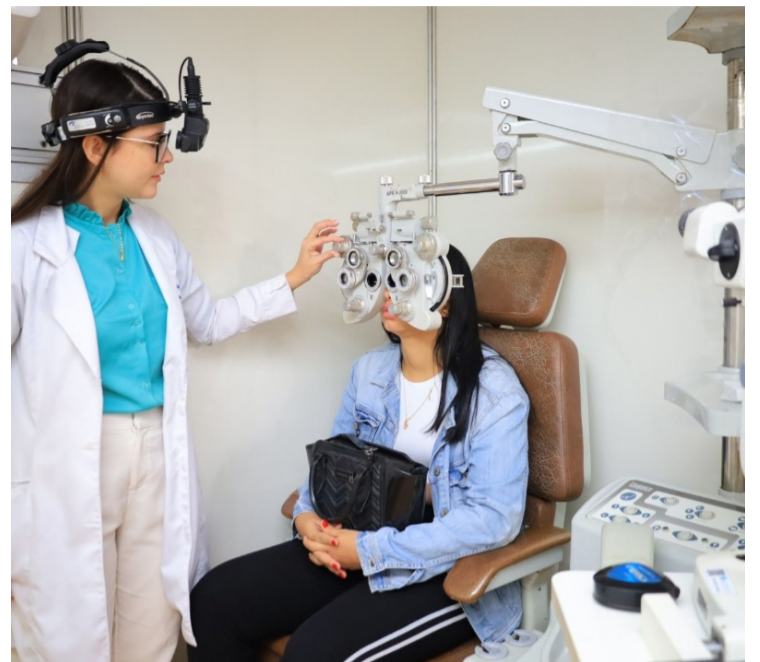
Mutirão realizado pela Prefeitura de Goiânia no último final de semana contabiliza 50 mil atendimentos

Durante o fim de semana de Mutirão, sábado (22/6) e domingo (23/6), a Prefeitura de Goiânia entregou escrituras de imóveis e sorteou mais de 120 famílias inscritas no Programa Casa da Gente. Os sorteados irão compor a lista de famílias selecionadas para apartamentos no Residencial Iris Rezende III, empreendimento em construção no Conjunto Vera Cruz, Região Oeste, em parceria com os governos estadual e federal.