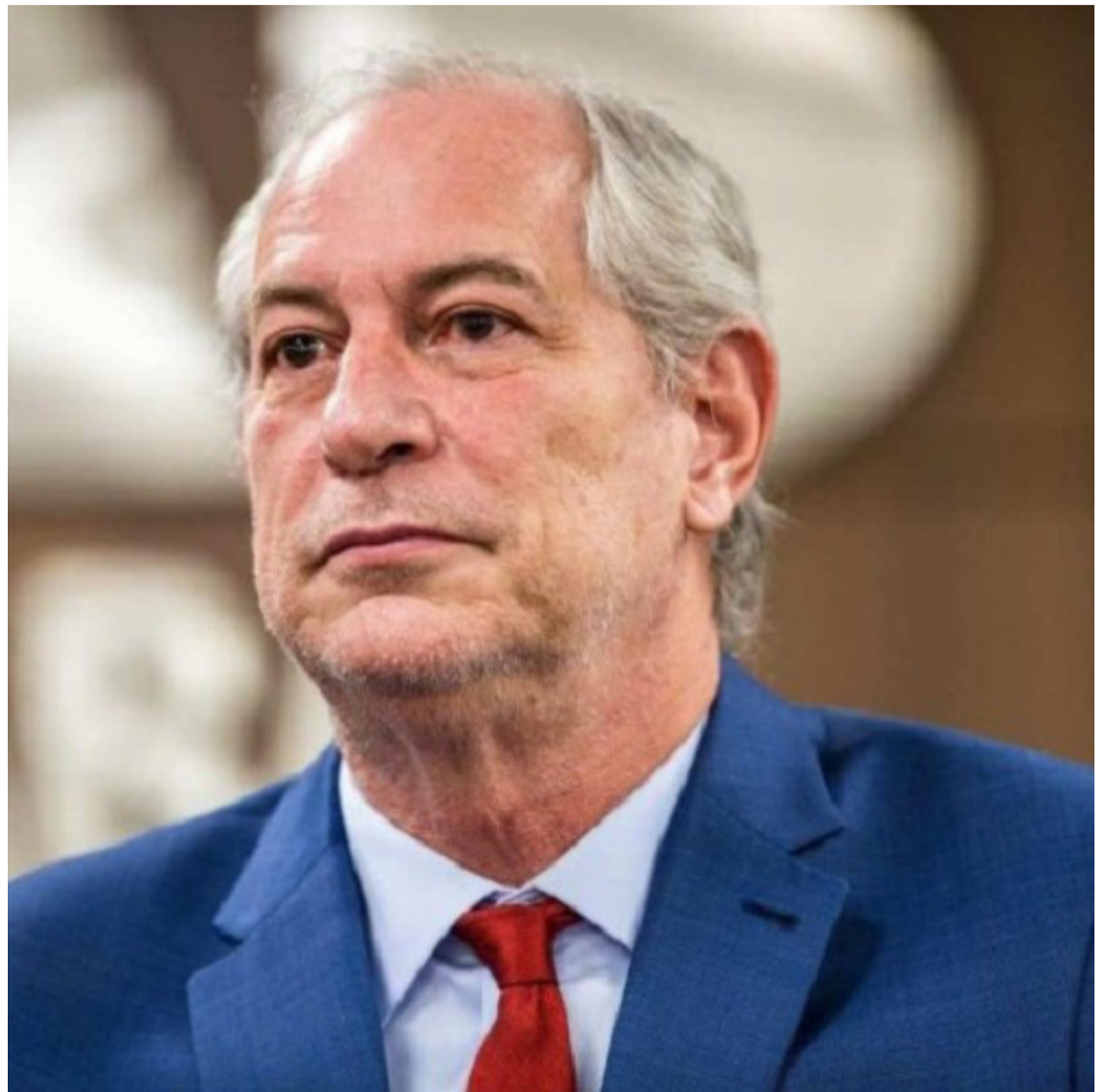
Ciro Gomes: Ronaldo Caiado tem trajetória política e experiência em gestão pública

O político cearense também criticou o comportamento da primeira dama Janja da Silva e diz que o “janjismo”, termo