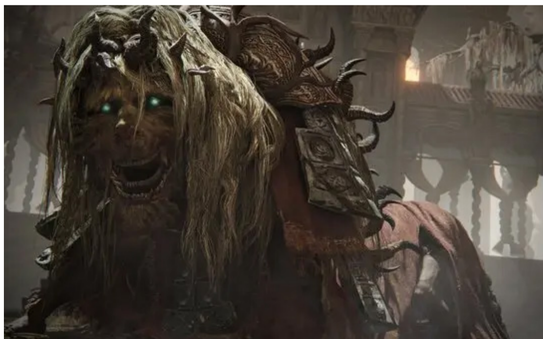
Jogo é vitória da desenvolvedora FromSoftware

chefes, novas armas, magias e armaduras e, principalmente, a promessa de responder questões prementes da história que ficaram sem explicação.