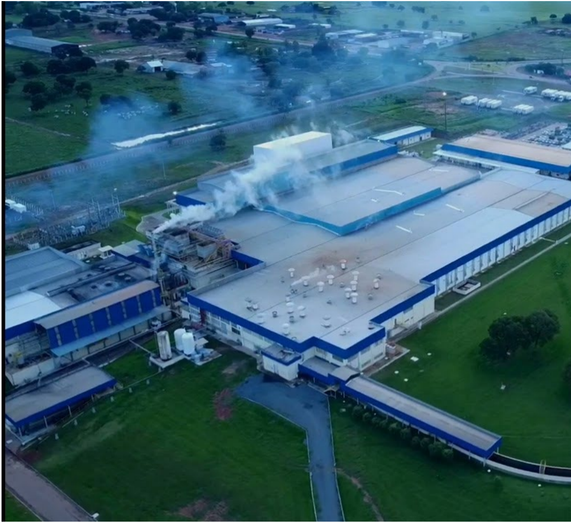
Unidade da JBS em Mozarlândia: empresa tem mais de 150 vagas de emprego abertas em Goiás

Unidades da Friboi de Goiânia e Mozarlândia estão com oportunidades disponíveis para jovens e adultos