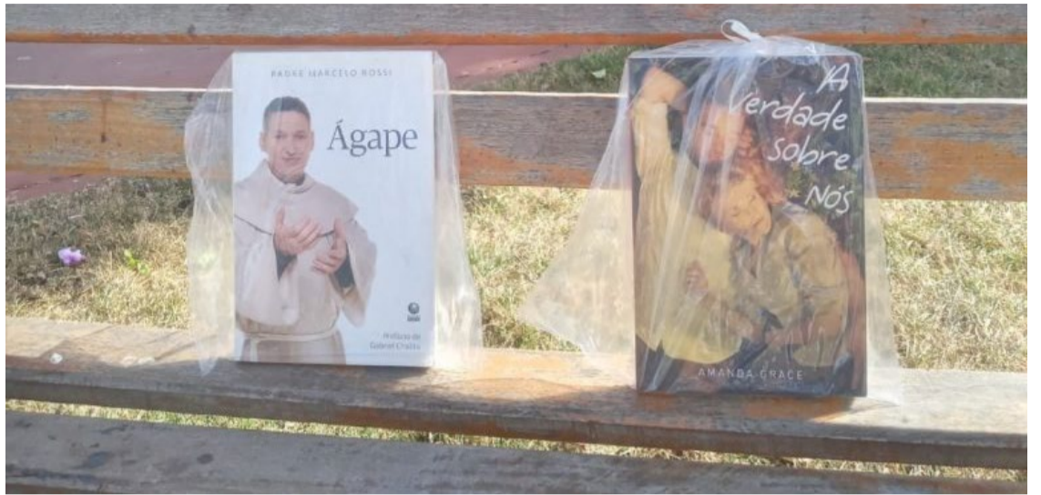
LIVRO NO BANCO DA PRAÇA: A Fundação Municipal de Cultura (FMC), realiza o projeto desde 2017